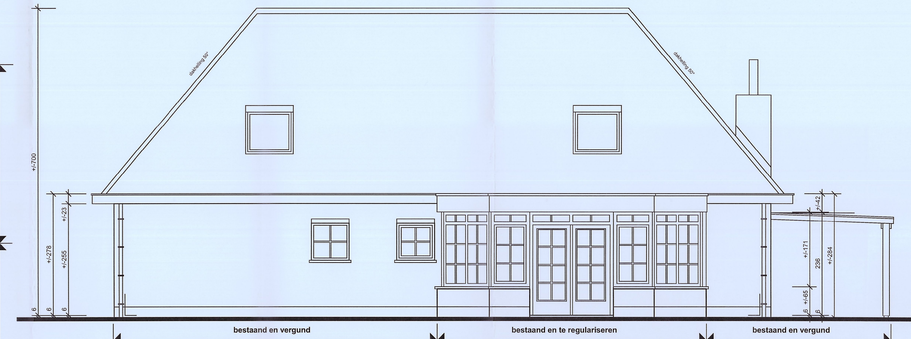
ACHTERGEVEL bestaande vergunde en te regulariseren toestand