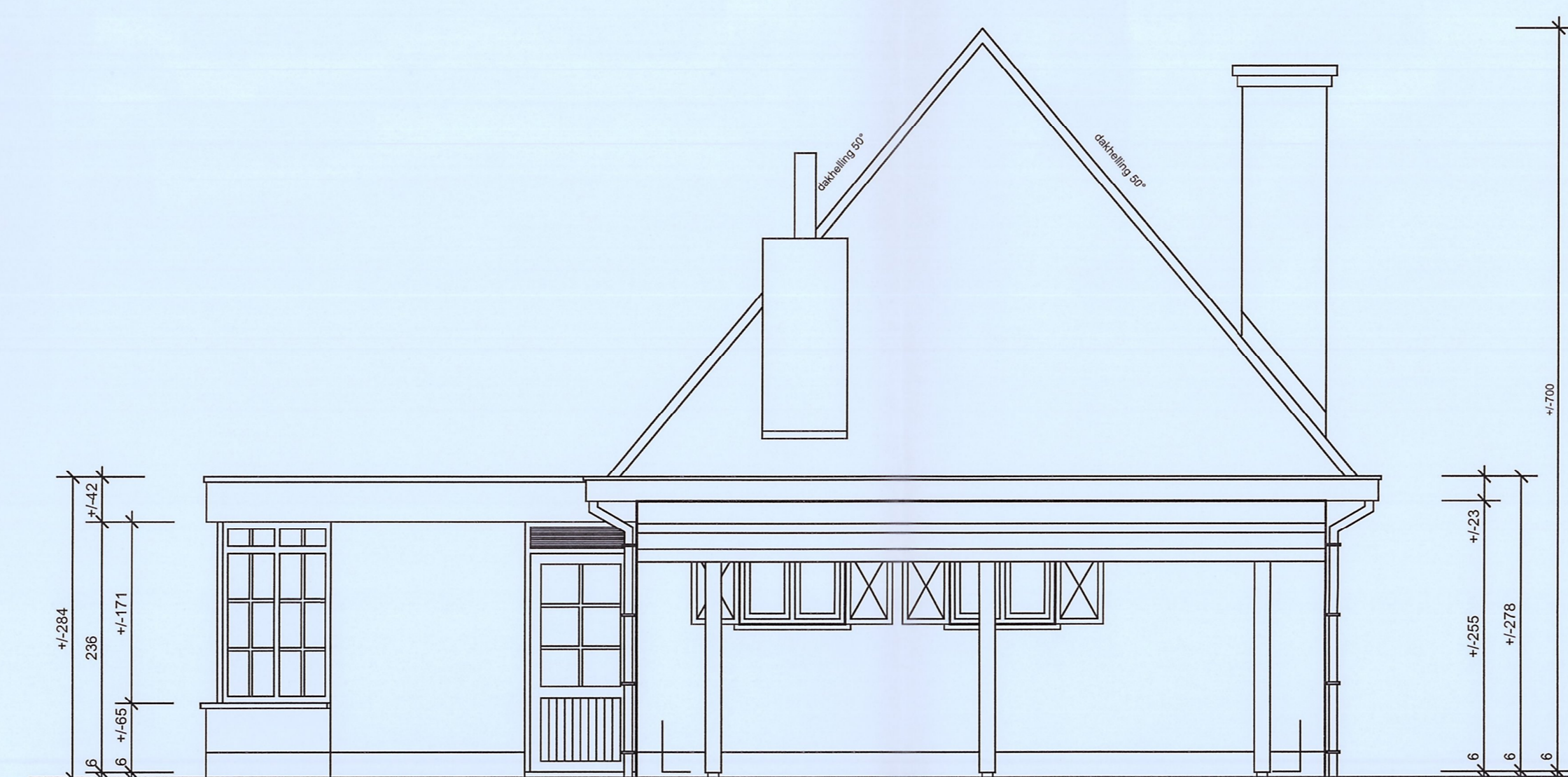
ZIJGEVEL LINKS bestaande vergunde en te regulariseren toestand