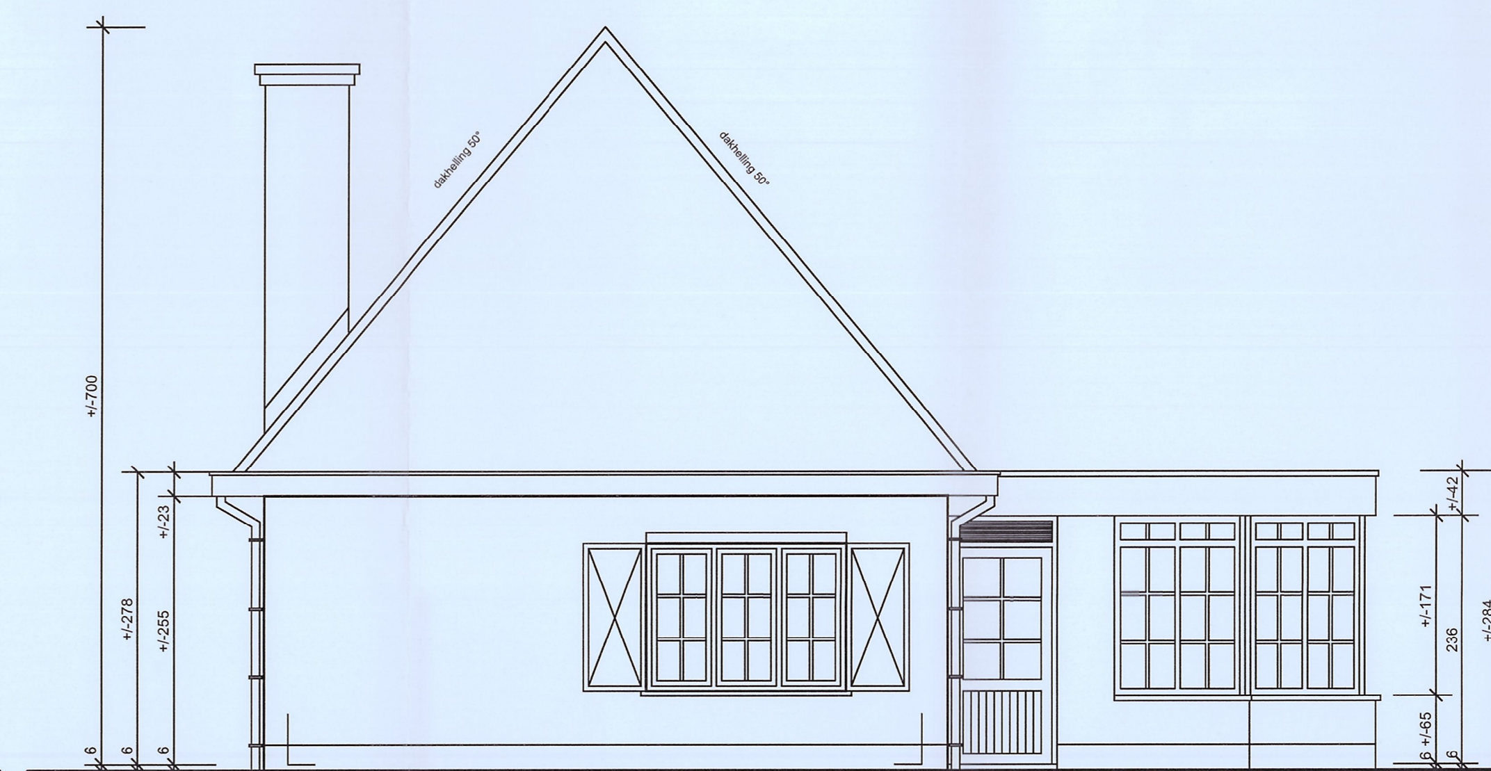
ZIJGEVEL RECHTS bestaande vergunde en te regulariseren toestand